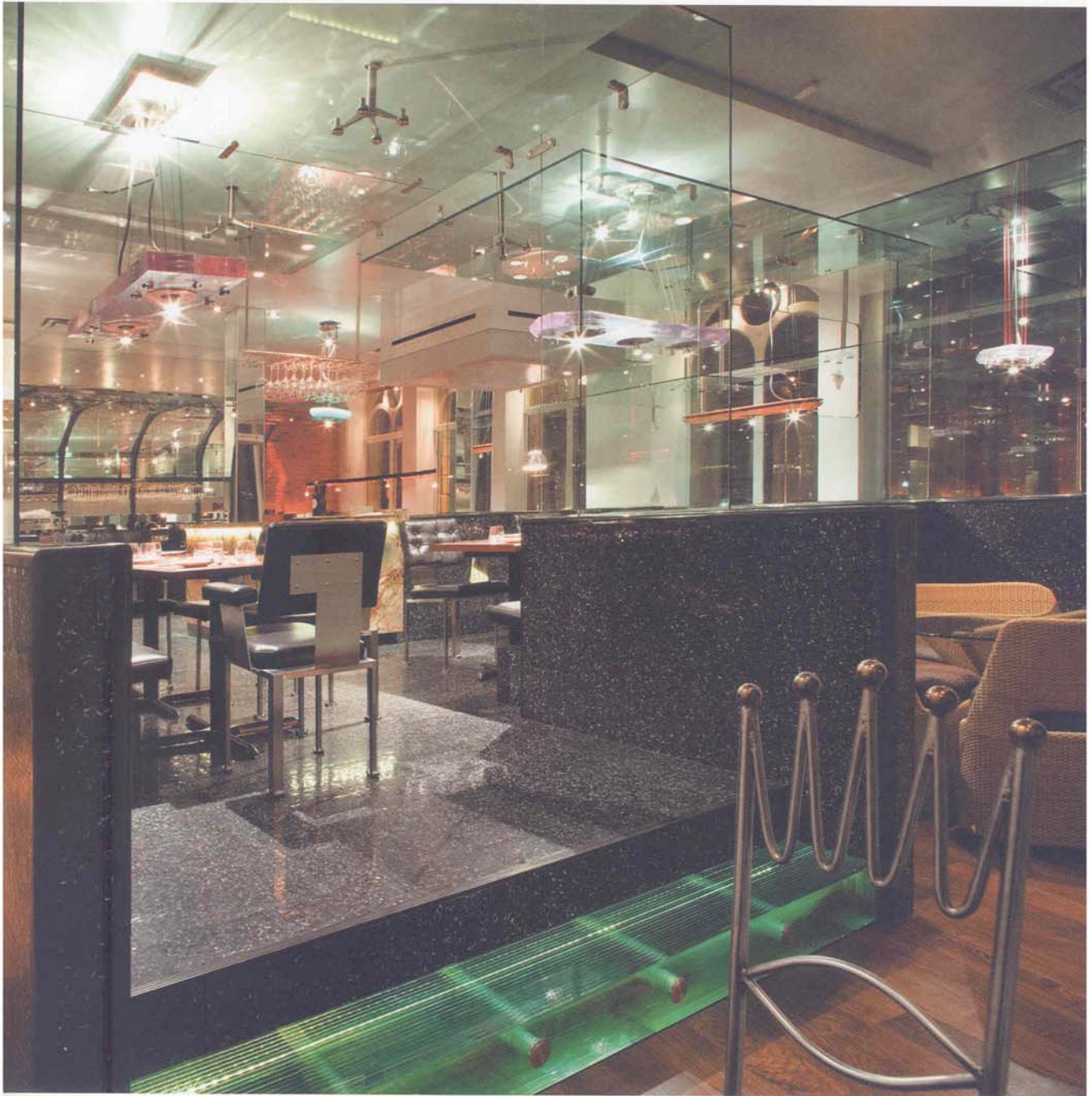
DNA, 2008, 355, Marguerite D'Youville, Montréal, QC (CAN), 514 287 3362.